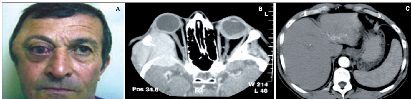
Figura 1 - A) Apresentação clínica - olho direito apresentava leve edema palpebral superior, discreta quemose e tumoração periocular em região temporal; B) Corte axial de um exame de tomografia computadorizada de órbita (janela de partes moles). Observa-se uma massa sólida comprometendo a asa maior do esfenóide à direita com extensão para fossa temporal, fossa média craniana e cavidade orbitária associada a proptose do globo ocular direito; C) Corte axial de um exame de tomografia computadorizada de abdômen (janela de partes moles): presença de lesão heterogênea de limites imprecisos no lobo hepático esquerdo.

Este tumor comumente metastatiza para os pulmões, cérebro e ossos. Outros locais menos freqüentes seriam o peritônio e a glândula adrenal, e raramente a cavidade nasal, órbita, bexiga, ovário, glândula parótida, calvário (5-8) .