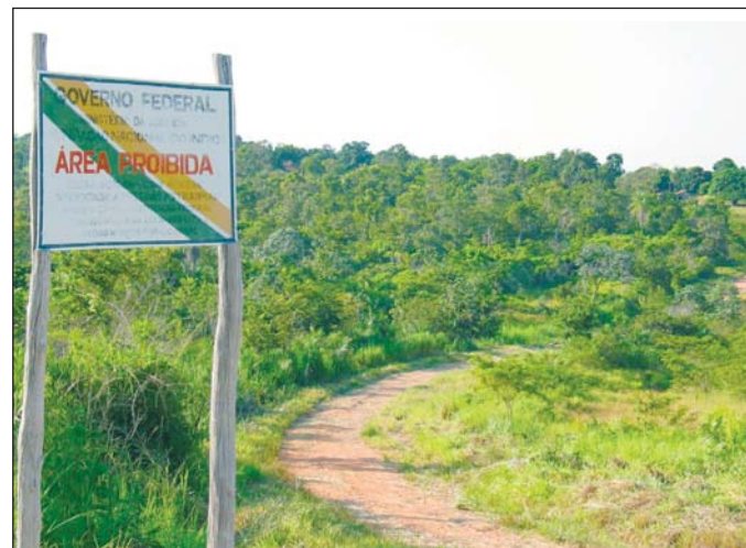
Figura 1 - Vista da entrada da aldeia Lalima. A vegetação é a típica do cerrado sul-mato-grossense.

O presente estudo foi realizado na população indígena da aldeia Lalima na região pantaneira de Miranda, Mato Grosso do Sul. Segundo dados do chefe de posto da FUNAI na aldeia, a população atual é de 1.389 índios, da etnia Terena. A aldeia fica localizada a 48 quilômetros de Miranda-MS, que por sua vez está localizado a 210 quilômetros de Campo Grande-MS.