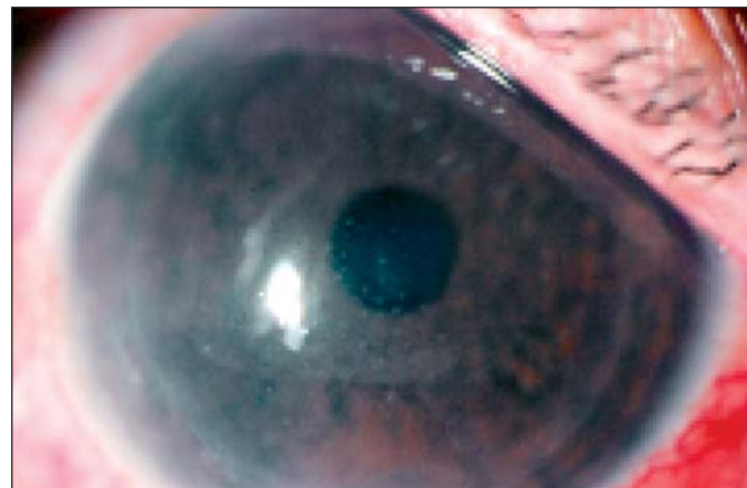
Figura 1 - Nota-se hiperemia conjuntival, com reação de câmara anterior e precipitados ceráticos

Relatos de acúmulo de fluido e descolamento do flap foram previamente descritos na literatura (23-25) . O mecanismo proposto para tal condição é o aumento da pressão intra-ocular causando o edema do tecido corneano, culminando na coleção líquida na interface (23,26) . Nestes casos é bem estabelecido que a pressão intra-ocular medida por aplanção sobre a re-