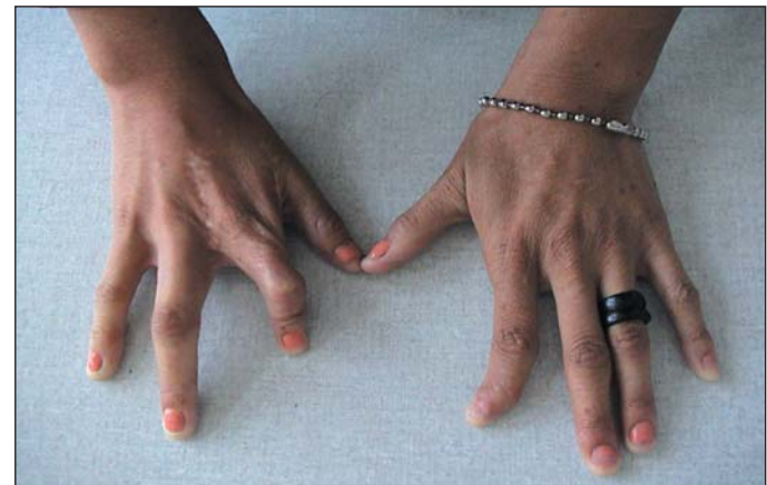
Figura 2 - Ectrodactilia de mãos