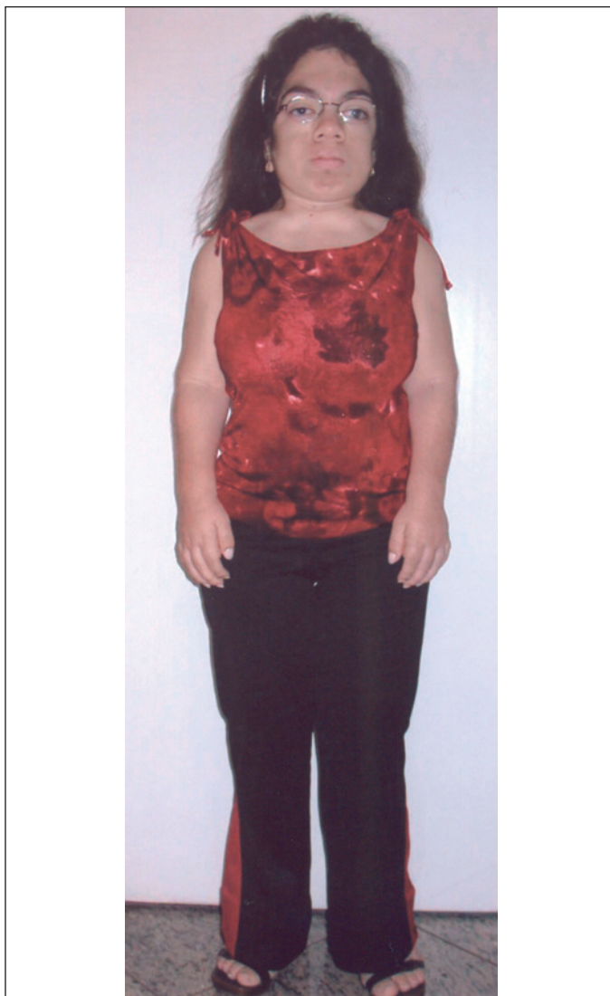
Figura 1 - Alterações ectópicas

Devido aos resultados obtidos a partir dos exames clínico e complementar, foi decidido pela suspensão da medicação