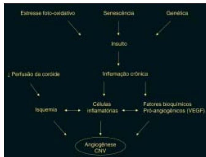
Figura 1 - Representação esquemática da fisiopatogenia da degeneração macular relacionada à idade