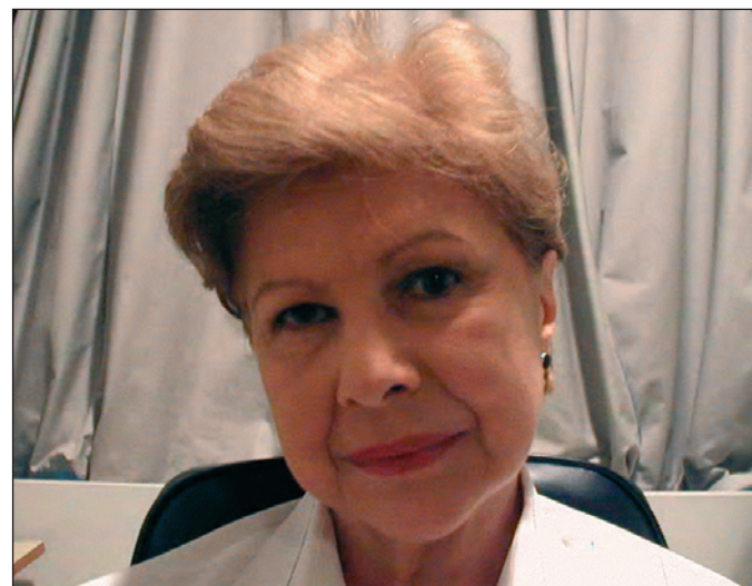
Figura 1 - Posição viciosa de cabeça: inclina e gira para a direita

Nos casos de diplopia intratável, métodos convencionais, como o uso de prismas e cirurgia, não apresentam resultados satisfatórios (2-3,8) . Segundo um autor (2) , o borramento da imagem de um dos olhos seria condição razoável, que deveria deixar médico e paciente satisfeitos.