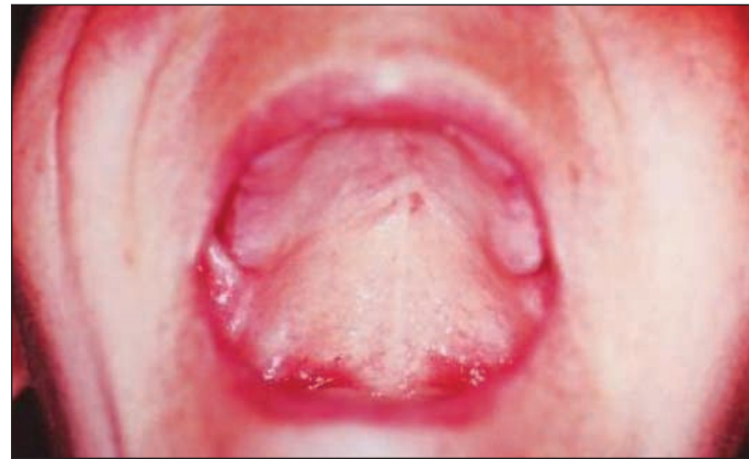
Figura 3 - Fístula oro-nasal cicatrizada

mucosa de palato duro (11) . O paciente do caso 2 apresentou fístula oro-nasal na primeira semana do pós-operatório, o orifício localizava-se entre palato duro e palato mole (Figura 2).