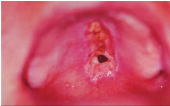
Figura 2 - Fístula oro-nasal: 4º pós-operatório