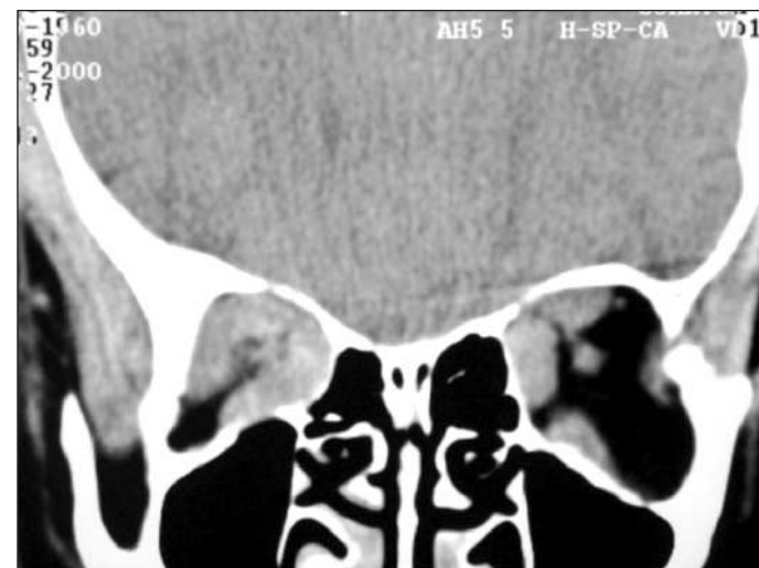
Figura 1 - Tomografia computadorizada de órbitas, corte coronal, mostrando, à direita, importante espessamento muscular no ápice orbitário com compressão do nervo óptico ("apical crowding")

O resultado cirúrgico mais valorizado é o aumento das dimensões do ápice orbitário. Levando-se em conta que o principal mecanismo aventado para a perda visual na OG é a compressão do nervo óptico no ápice orbitário pela musculatura alargada ("apical crowding") (22) , é fácil aceitar a noção de que a descompressão orbitária pode realmente beneficiar os pacientes com neuropatia óptica por doença de Graves.